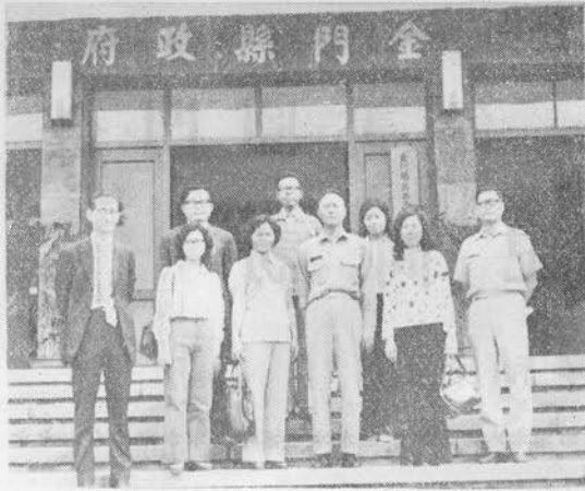
訪問團一行與縣縣長攝於金門縣政府前

應用科學：九四六冊 社會科學：三、四七四冊 史地：三、四一二冊（包括中外史地） 語文：六、〇七〇冊（包括兒童文學） 美術：二二四冊 西文：七四八冊