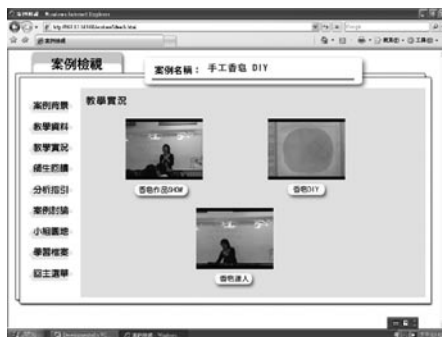
圖6 教學實況影片選擇畫面