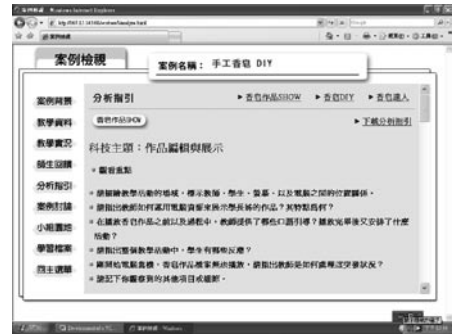
圖8 案例分析指引畫面