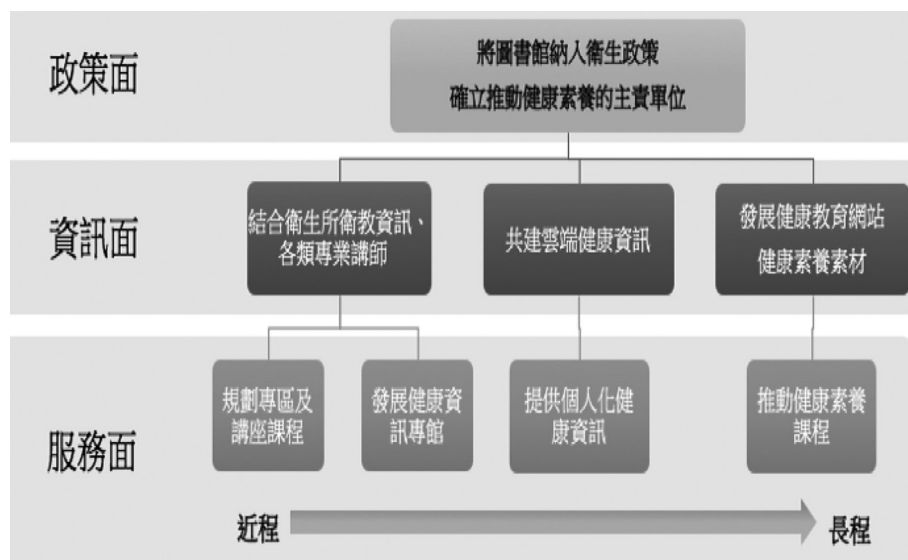
圖2 公共圖書館與衛生所未來合作推動健康促進服務之方向

式，但本研究發現，衛生所已針對不同年齡群體的好發疾病規劃服務，而公共圖書館的健康資訊服務係以老年人為主。身為地方資訊中心的公共圖書館應扮演健康資訊供應者及健康素養教育者的重要角色，透過盤點區域內可運用的資源設計健康資源專區及規劃健康資訊專館，並搭配衛生所的健康檢查及健康計畫，融入健康資源，加上透過社區合作網絡，主動介入各場域推廣健康素養課程。其中保健分館適合作為公共圖書館強化健康資訊服務的起點，依據城市特性、在地居民需求、健康資訊行為的研究結果，規劃為城市健康資訊中心，讓各群體皆能獲取所需的健康資訊。而為強化館員提供健康資訊服務能力，應鼓勵公共圖書館館員進修健康相關系所課程，使其對健康資訊及資源有更全面性了解，甚至考慮參考美國醫學圖書館及協會的方式，由醫學圖書館主導發展健康資訊館員的專業認證制度，提供公共圖書館員相關專業證照考試及認證，以提供讓民眾信任的健康資訊服務。